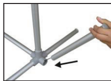
Pied raccordé à des élastiques